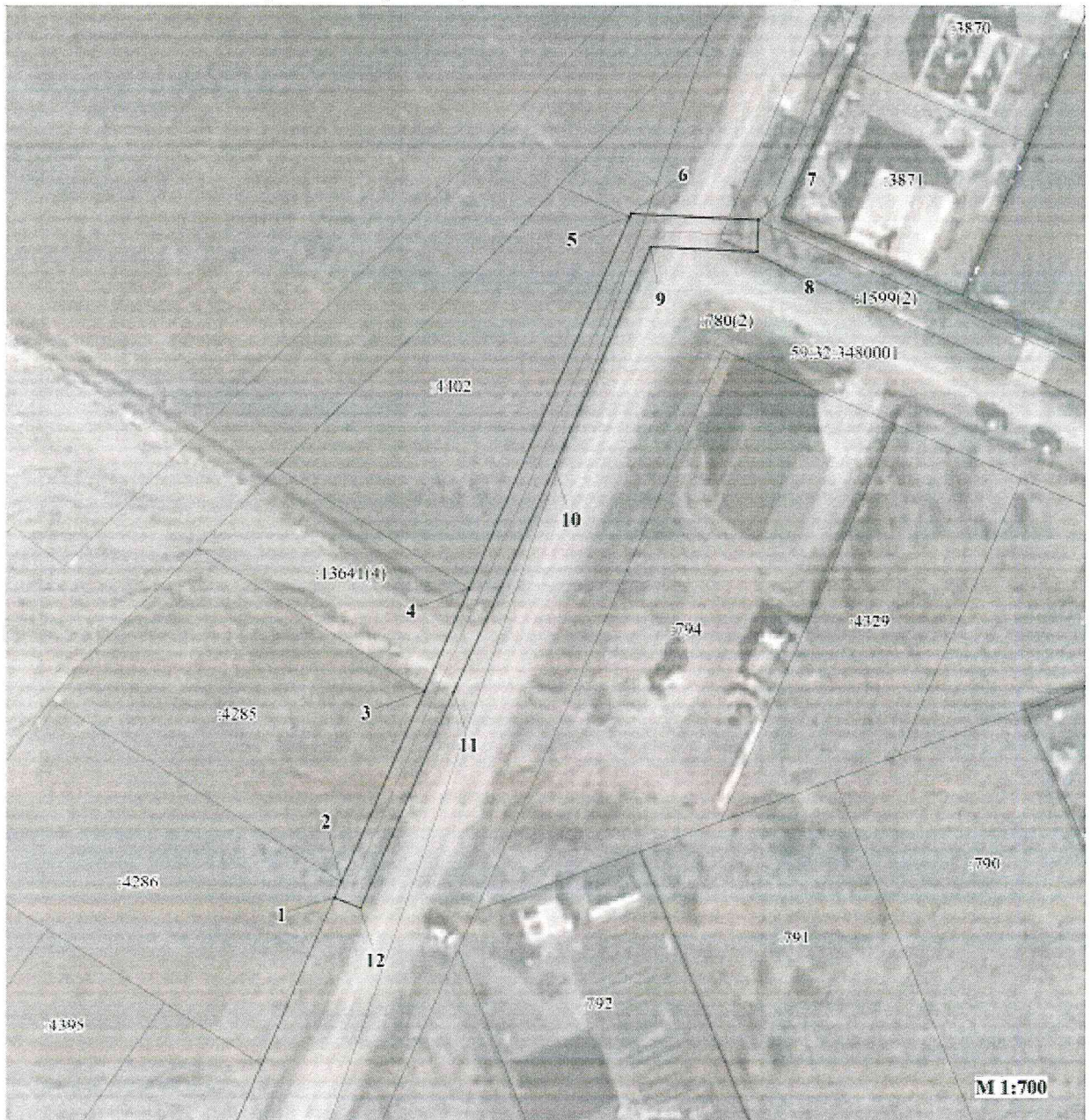
СХЕМА РАСПОЛОЖЕНИЯ ГРАНИЦ ПУБЛИЧНОГО СЕРВИТУТА «Строительство участка ВЛ 0,4 кВ от ближайшей опоры ВЛ 0,4 кВ от ТП-6708, установка оборудования учета э/э на опорах ВЛ 0,4 кВ для электроснабжения малоэтажной жилой застройки по адресу: Пермский край, Пермский район, д. Большая Мось (кад. номер зем. участка 59:32:3480001:4286)»

Приложение № 1 к распоряжению комитета имущественных отношений администрации Пермского муниципального округа от 15.04.2024 № 1069